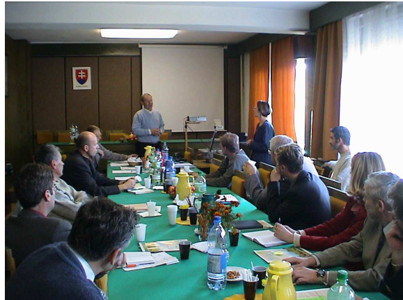
Záujem o výsledky výskumu zo strany farmárov = ocenenie práce výskumníkov!